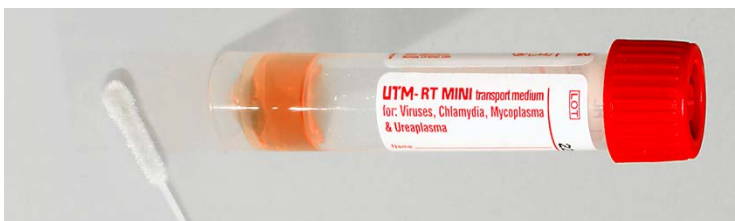
UTM-Medium (Art. 360C)

Nasopharyngealtupfer mit biegsamem Plastikstab und Sollbruchstelle, sowie UTM-Medium zur Stabilisierung von RNA-Viren. Nach Entnahme soll der Tupfer sofort in das sterile Medium überführt werden. Nach Einbringen in das Röhrchen Plastikstab an der Sollbruchstelle kürzen und Verschlusskappe wieder aufsetzen. Sputum oder Bronchiallavage können direkt in das sterile Medium gegeben werden. Das Medium sollte nur für die CAP-Virus-PCR – Untersuchungen wie z.B. Influenza-Virus-PCR, RSV-PCR etc. verwendet werden.