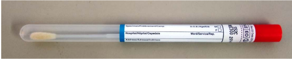
Copan beflackter Tupfer (Art. 552C)