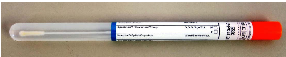
Copan Nasopharyngeal Tupfer (Art. 553C)

Nasopharyngealtupfer mit biegsamem Plastikstab zur Gewinnung von Nasopharyngealabstrichen speziell bei Verdacht auf Pertussis bzw. Parapertussis bzw. für die CAP-Bakterien-PCR